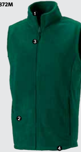
Herren - 872M