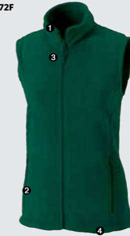
Damen - 872F