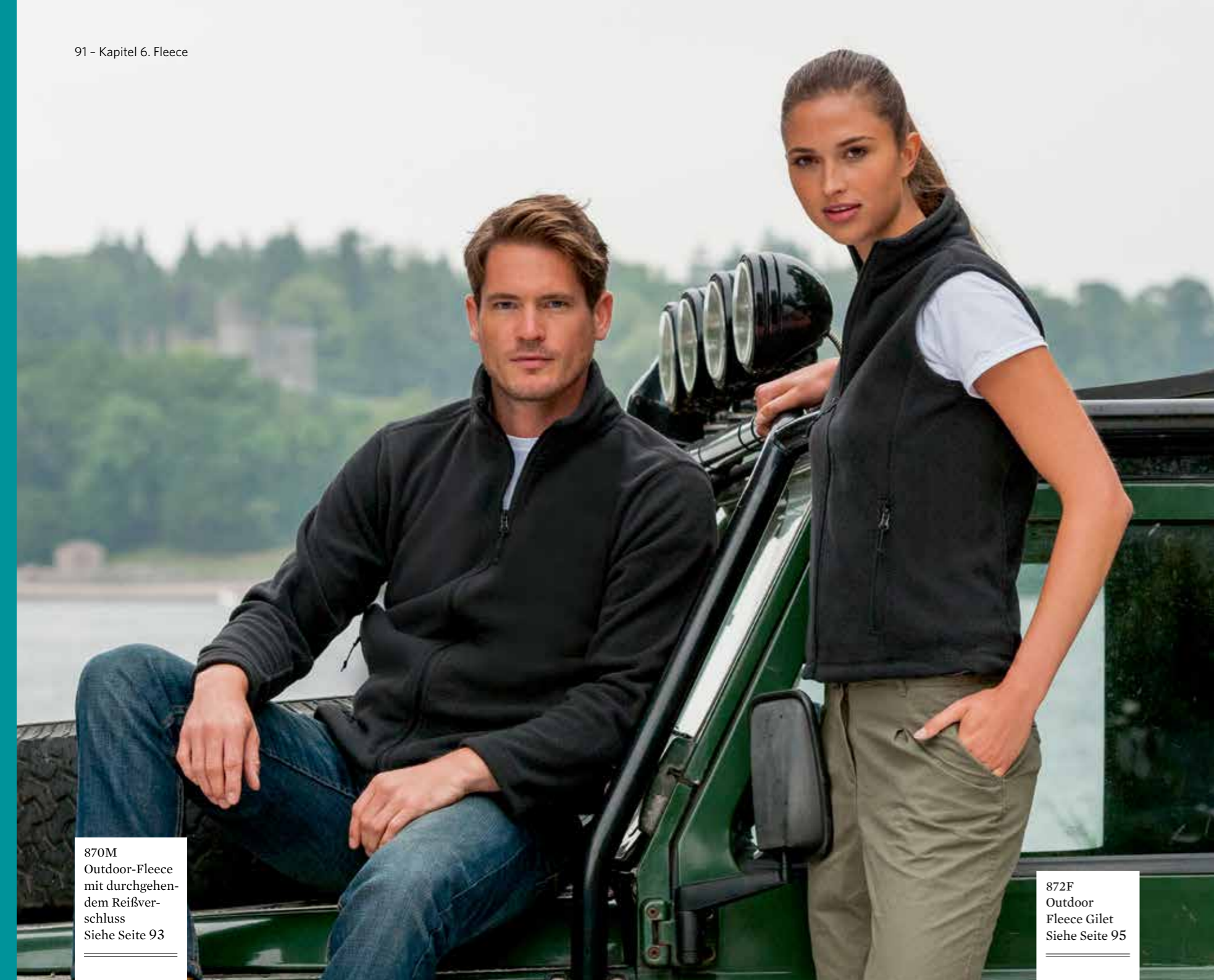
870M Outdoor-Fleece mit durchgehen- dem Reißver- schluss Siehe Seite 93