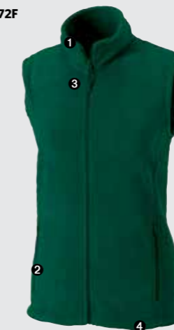
Femme - 872F