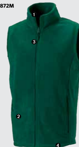
Homme - 872M